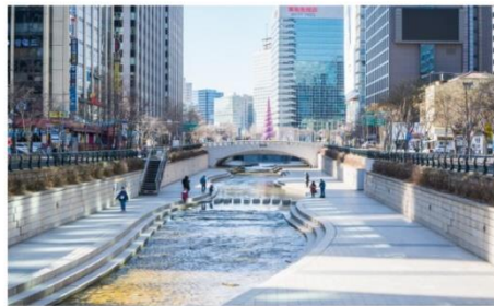
คลองชองกเยซอน