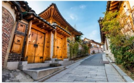
หมู่บ้านโบราณบุกซอน