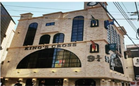
คาเฟ่แฮรี่พ็อตเตอร์