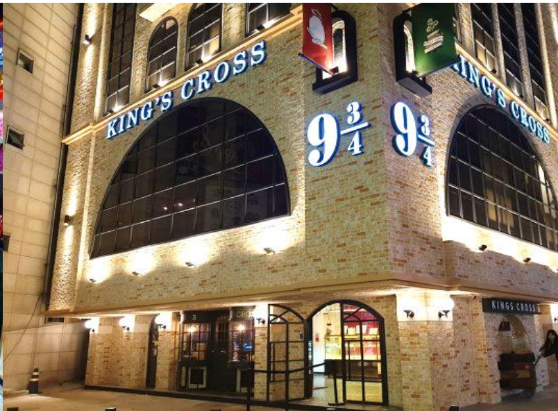
แหวง... บริการอาหารกลางวัน ณ พิพิธภัณฑ์

ห้องสมุด Starfield Library ห้องสมุดสุดชิคแห่งนี้เป็นที่เชิคอินแห่งใหม่ของกรุงโซลมีการออกแบบที่สวยงามแปลกตา