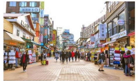
ย่านฮงแด