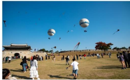
ป้อมปราการฮวาซอง