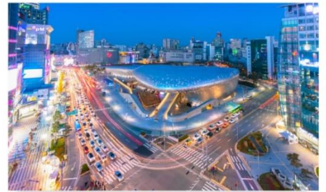
ทงแดมุน ดีไซน์ พลาซ่า