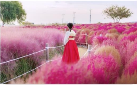
ชมทุ่งหญ้าสีชมพู